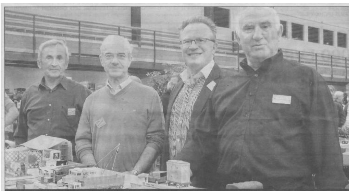
Les organisateurs sont ravis du succès d'un salon qui s'affirme bien au-delà des frontières de la ville